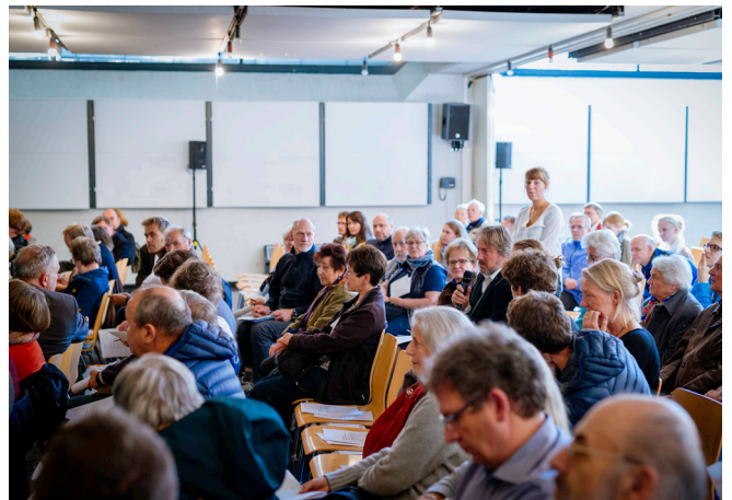
Abbildung 4: Impressionen aus dem Bürgerworkshop am 22.10.2016.