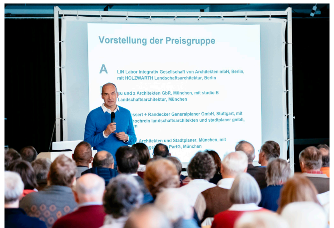
Abbildung 3: Zeilen 1 bis 3: Impressionen aus der Ausstellungseröffnung am 13.10.2016. Unterste Zeile: Impressionen aus dem Bürgerworkshop am 22.10.2016.