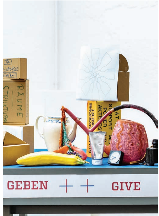
Anna Jäger +++ Fair-Teiler, Brauchbar +++

leonrod-haus.de/Canesiraum/Canesiraum.html